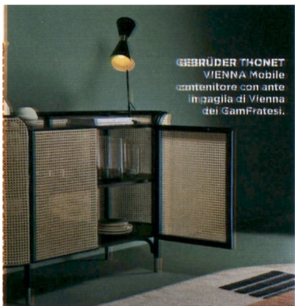
GEBRÜDER THONET VIENNA Mobile contenitore con ante in paglia di Vienna dei GamFratesi.